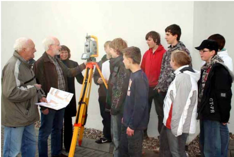
Preisträger aus Pasewalk (2.Preis)

Ein 2. Preis ging an die Schülerinnen und Schüler der Klassenstufe 8,9,10 des Oskar-Picht-Gymnasiums Pasewalk für ein Informationssystem „ Stadtbildentwicklung Pasewalk vor 1945 “